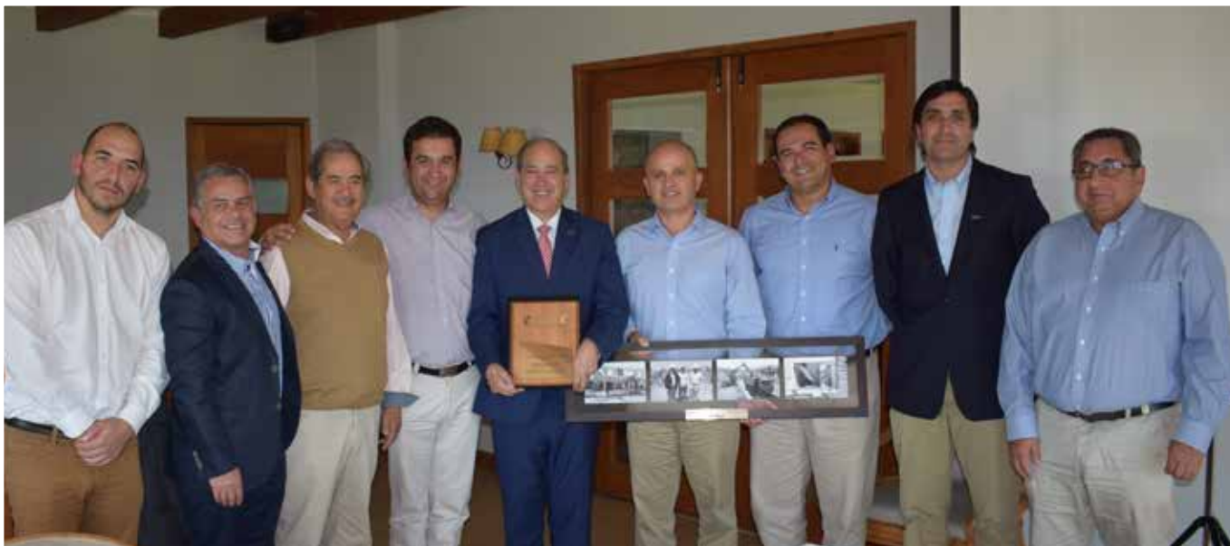
Encuentro presidente nacional con Mesa Directiva y Consejeros Regionales en el que se abordó las labores desarrolladas en Santa Olga.