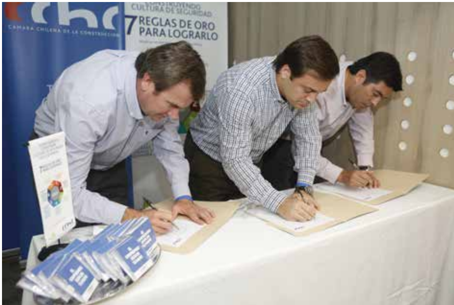
Adhesión representantes de constructoras socias a Compromiso Cero Accidentes