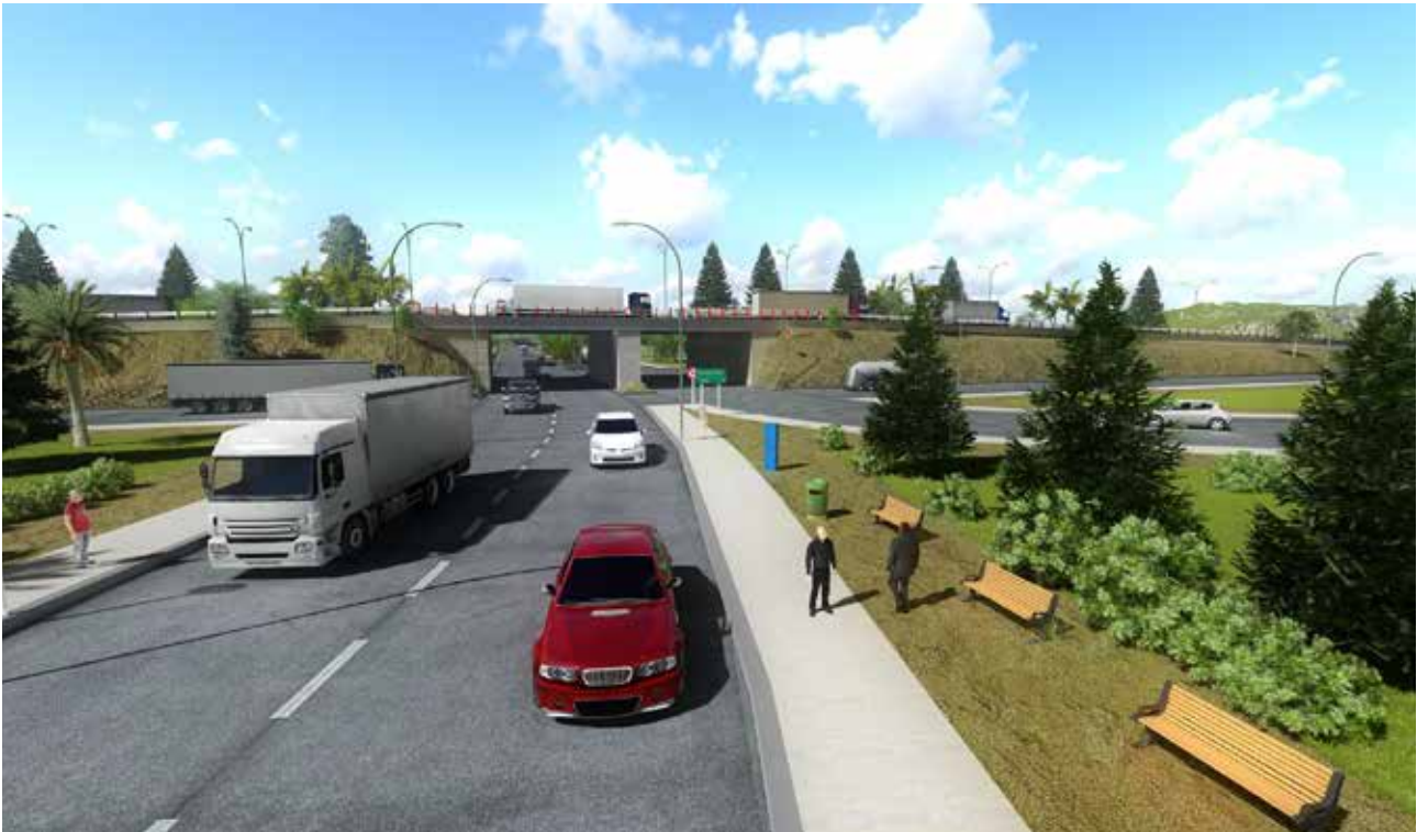
Par Vial Avenida España Rucatremu

a través de su infraestructura”, encuentro que tuvo entre sus expositores al ministro de Obras Públicas, Alberto Undurraga.