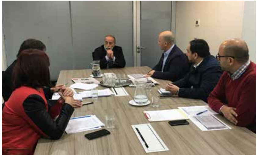
La CChC Talca ha sostenido diversos encuentros con autoridades de la zona para plantearles la relevancia de la planificación de las ciudades.