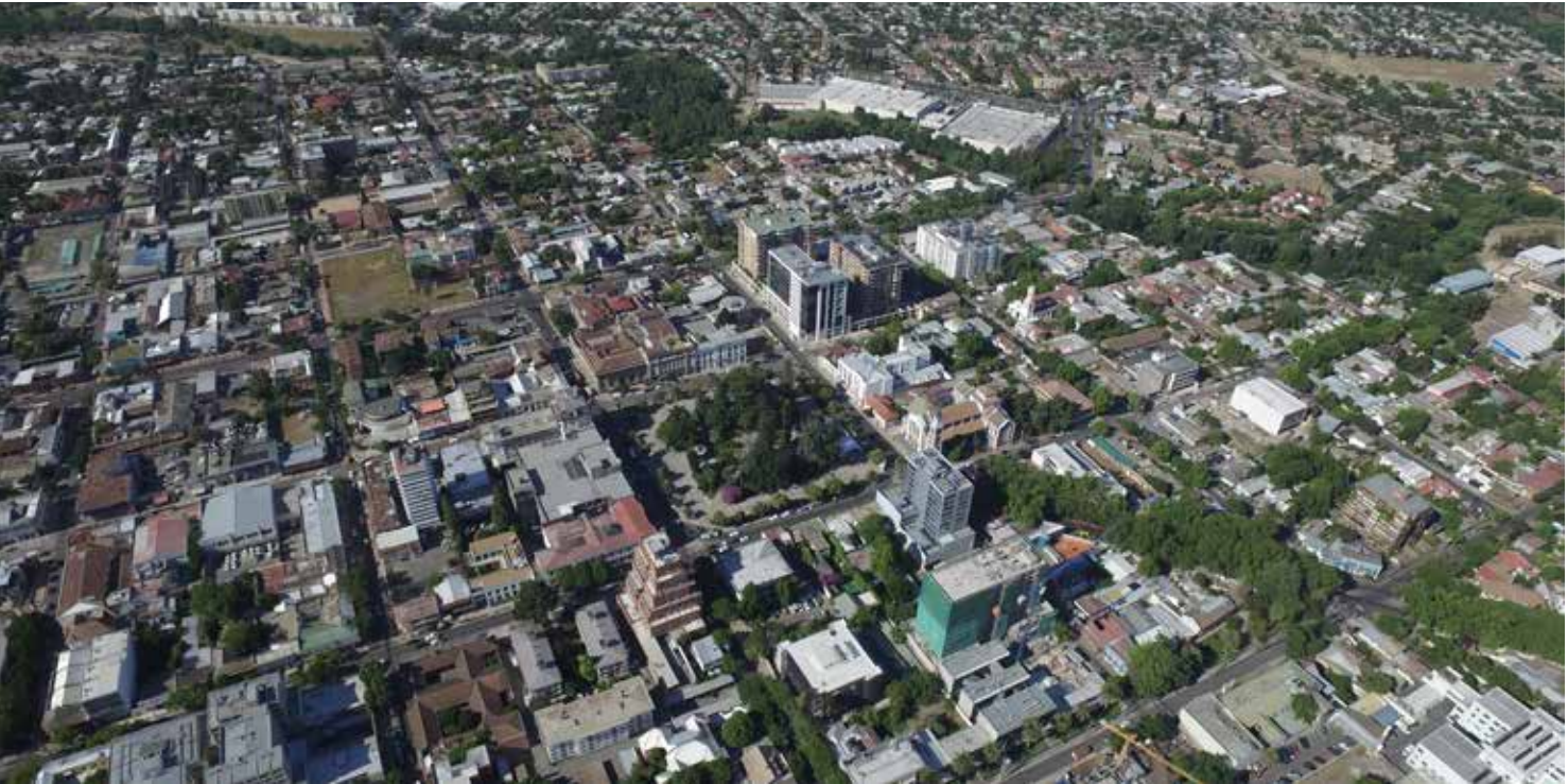
Mirada aérea de Talca