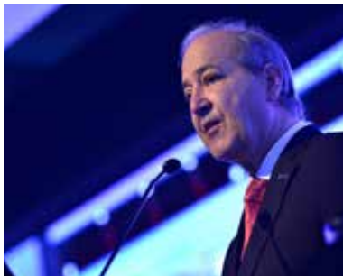
Sergio Torretti, Presidente Nacional de la CChC.

Según el presidente nacional del gremio de la construcción, ello daría un marco normativo que permitiría entregar opciones a las personas de quedarse cerca de sus familias y de las redes de apoyo social. ‘O no están los precios adecuados para que puedan quedarse o no está la oferta’, comentó Torretti.