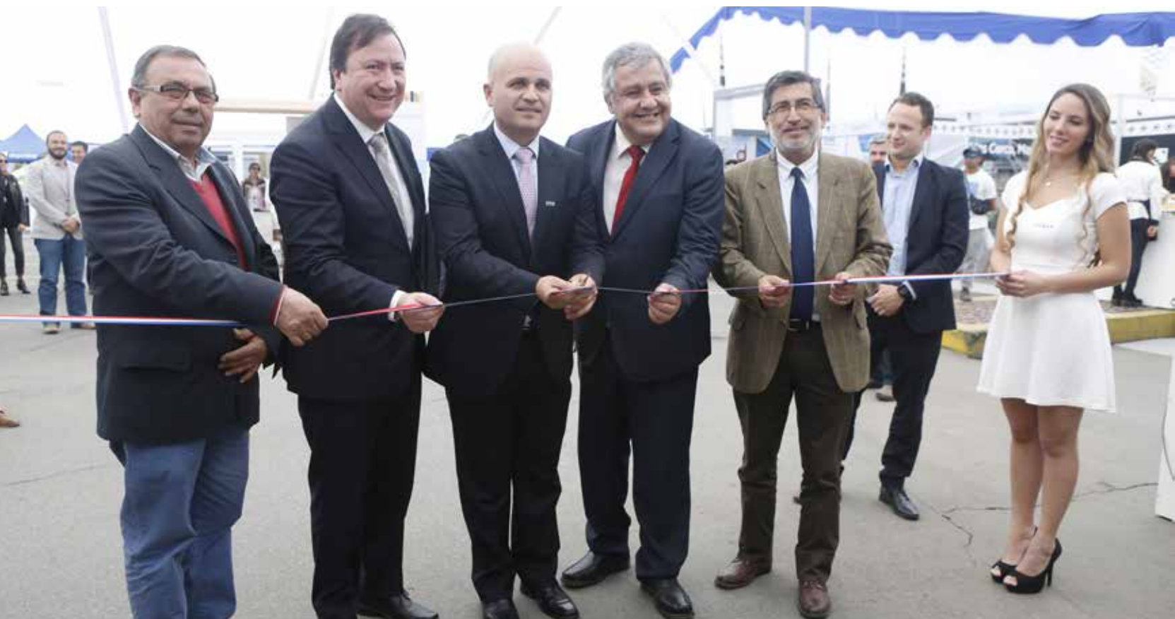
Corte de cinta en inauguración de FINTA 2017

En un nuevo lugar de exhibición, la muestra inmobiliaria organizada por la Cámara Chilena de la Construcción (CChC) Talca concentró el 90 por ciento de la disponibilidad de viviendas en el Maule. La evaluación de los expositores y los visitantes fue muy positiva.