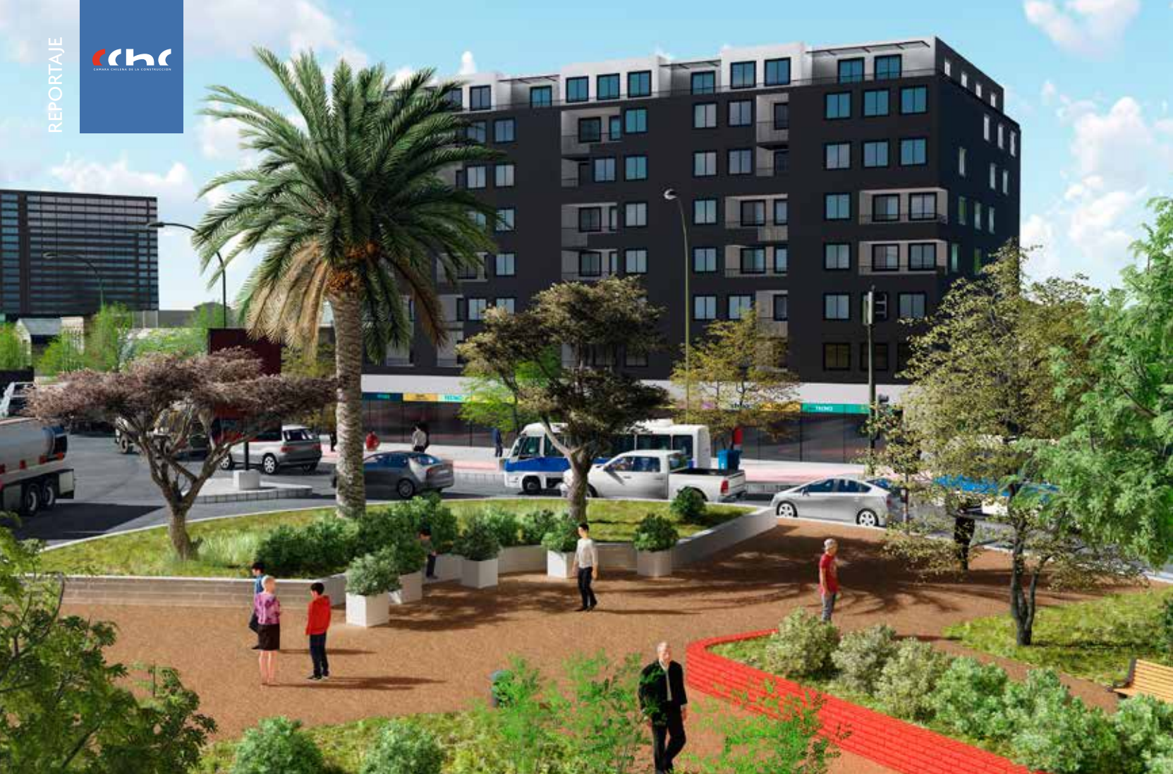
Imagen objetivo: Densificación casco histórico de Talca