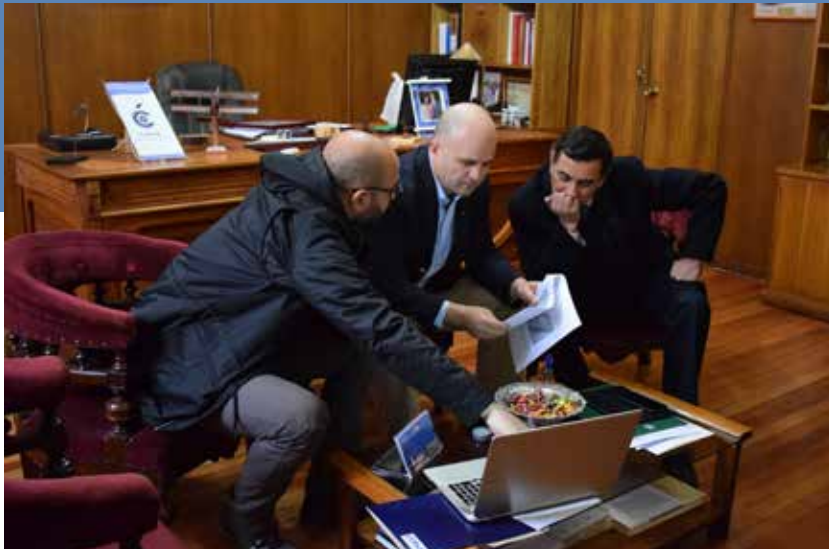
Reunión con alcalde de Curicó, Javier Muñoz