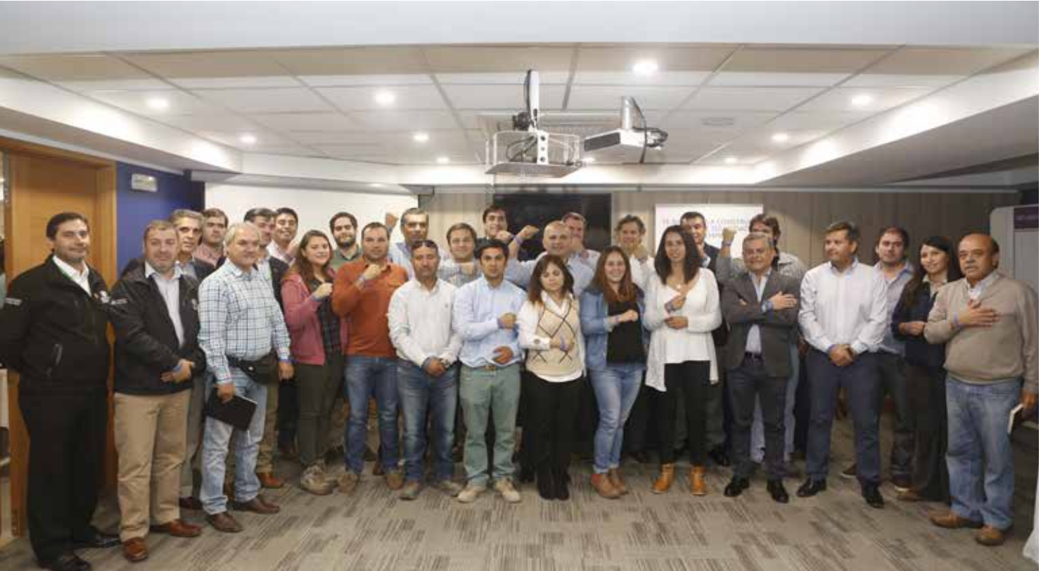
Empresas socias en Lanzamiento Campaña Cero Accidentes