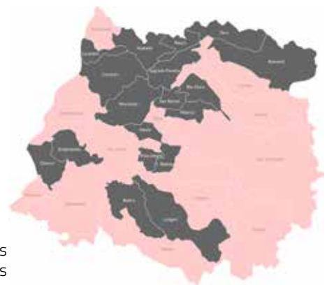
Mapa de comunas de la Región del Maule

nes pensando en el 2018. Hemos pensado en 661 millones de pesos proyectados a cuatro años, vale decir, entre el 2018 y 2021, lo cual nos permitiría especialmente echar a andar los procesos en las comunas de Rauco, Sagrada Familia, Río Claro, Empedrado y Chanco, además de planes seccionales de Yervas Buenas y Vichuquén. Acá también hemos contado con una permanente preocupación y colaboración de la Cámara Chilena de la Construcción con quienes nos hemos venido reuniendo para emprender algunas acciones concretas y también informar de la situación existente a nivel regional”, dijo la autoridad.