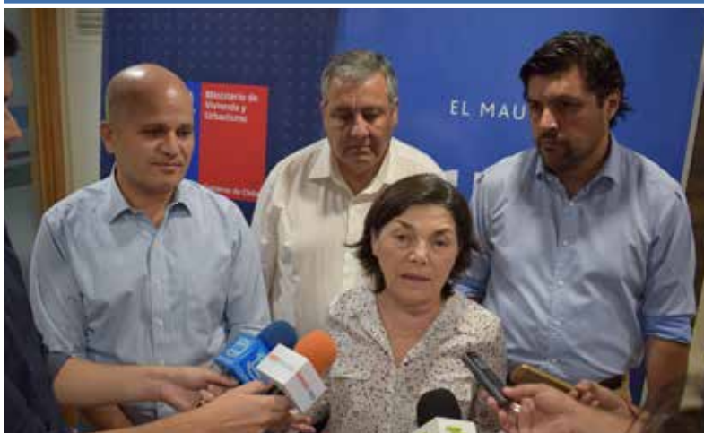
El gremio se reunió, a nivel local, con la ministra de Vivienda y Urbanismo, Paulina Saball para planificar estratégicamente el apoyo en terreno.