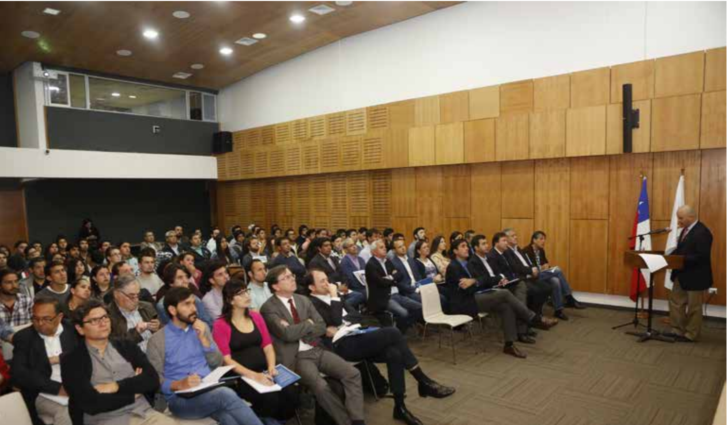
El seminario Visión de Ciudad convocó a autoridades locales, académicos, profesionales del sector y público en general

De esta forma, la propuesta de la CChC es generar un llamado especial del D.S. 19 que tenga como objetivo principal regenerar los terrenos abandonados dentro del casco histórico de la ciudad, idea que considera ciertas características, como que el programa se enfoque en la reconstrucción de la ciudad a través de un subsidio directo por medio de la oferta; que establezca un polígono de regeneración urbana en las manzanas definidas como parte del centro histórico de Talca de manera de densificar esta área; que se cree una imagen objetivo para generar una ciudad homogénea físicamente y heterogénea socialmente potenciando la identidad urbana; que propenda a la integración social, ofertando diversas tipologías de viviendas e incluyendo un 20 por ciento destinado a grupos vulnerables; y que tenga flexibilidad, con posibilidad de incorporar hasta un 20 por ciento de edificaciones no