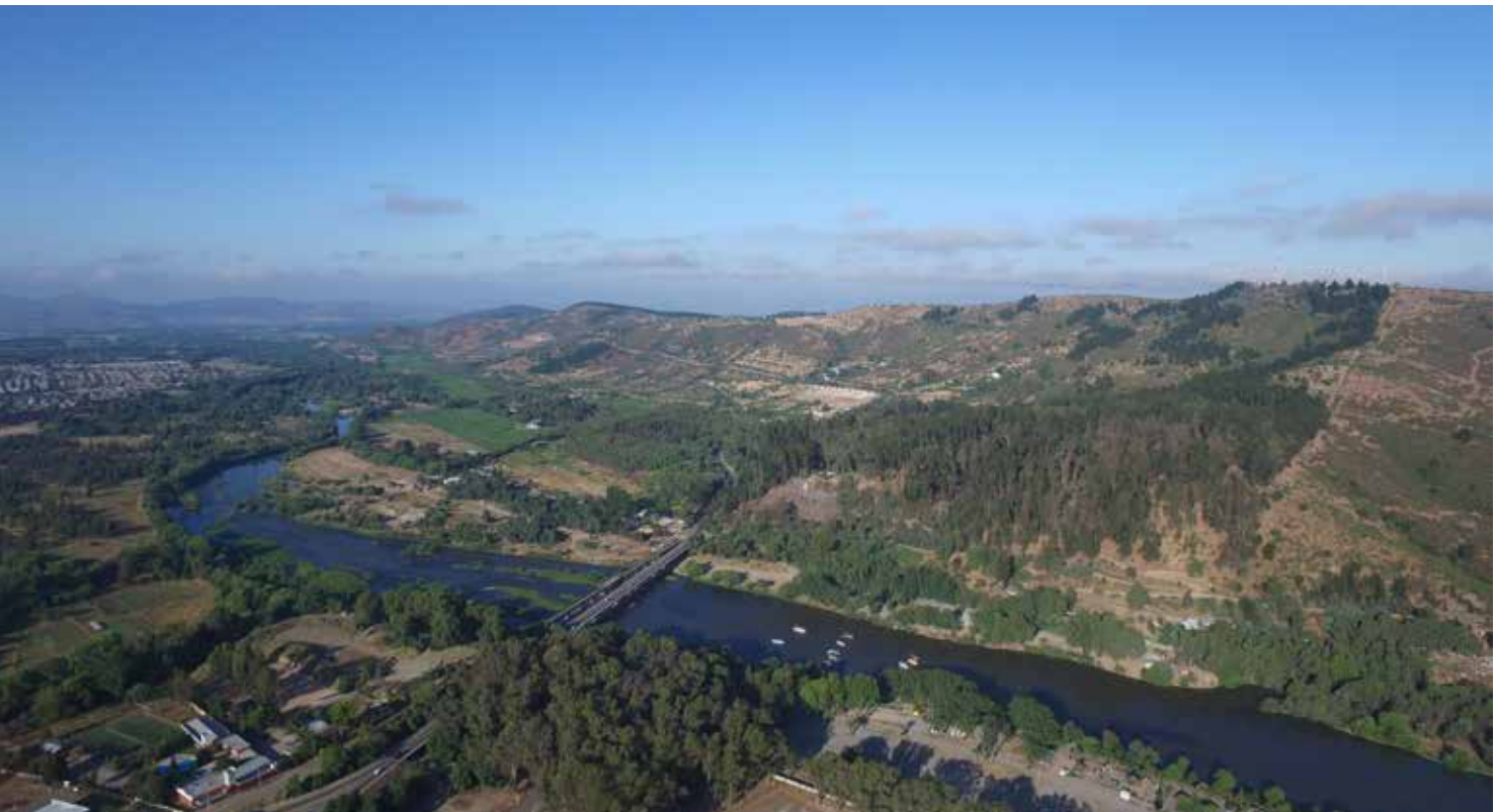
La ausencia o falta de actualización de los PRC deriva en una crisis de planificación o visión de ciudad

“ Es bueno destacar que se han logrado avances significativos durante la actual administración y se han aprobado los planos reguladores comunales de San Javier, Romeral, Curepto y Teno. En total nueve comunas cuentan con sus instrumentos actualizados y aprobados, sumándose 14 en trámites de revisión y respondiendo observaciones de Contraloría.