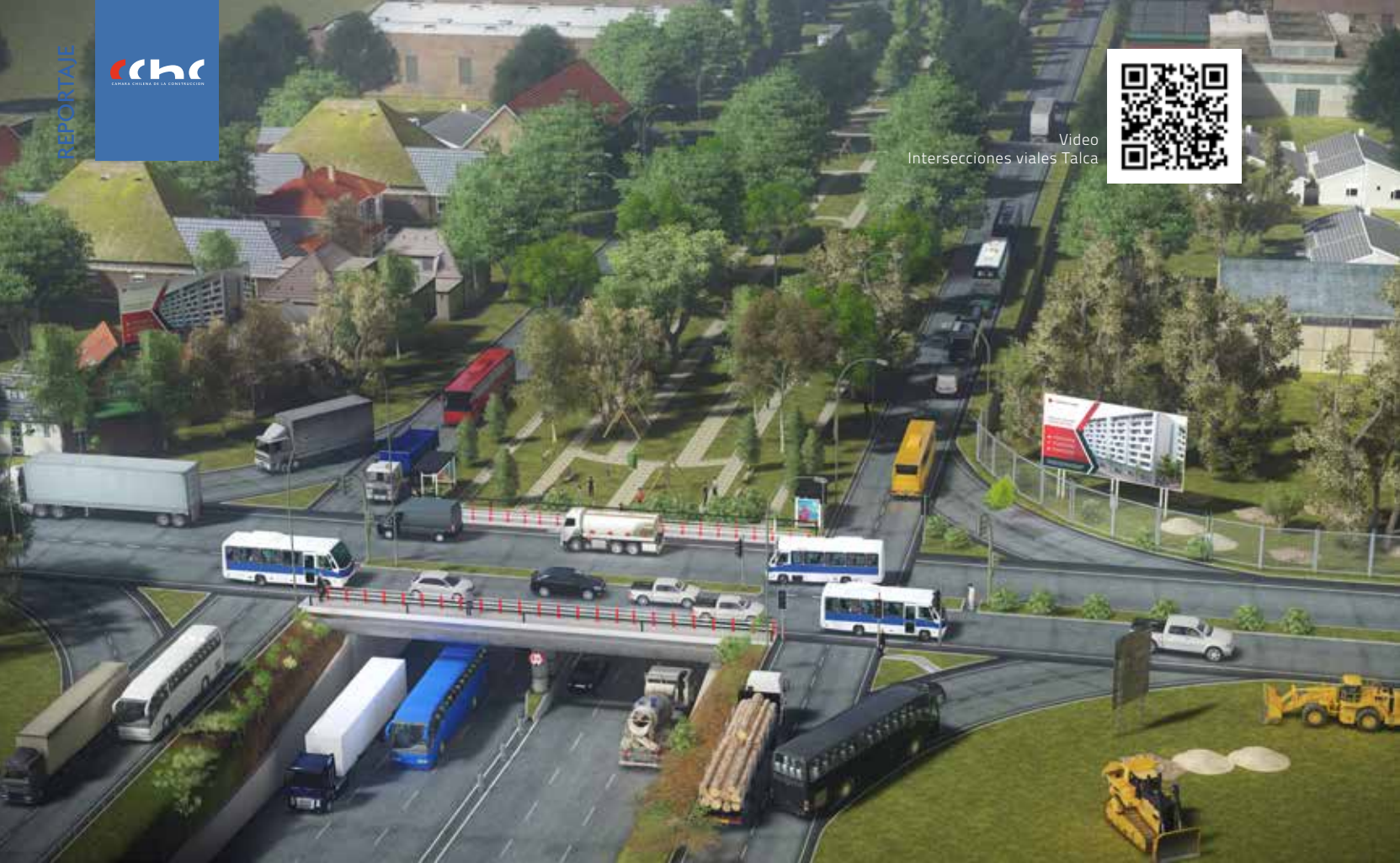
Parque sobre la carretera Cinco Sur