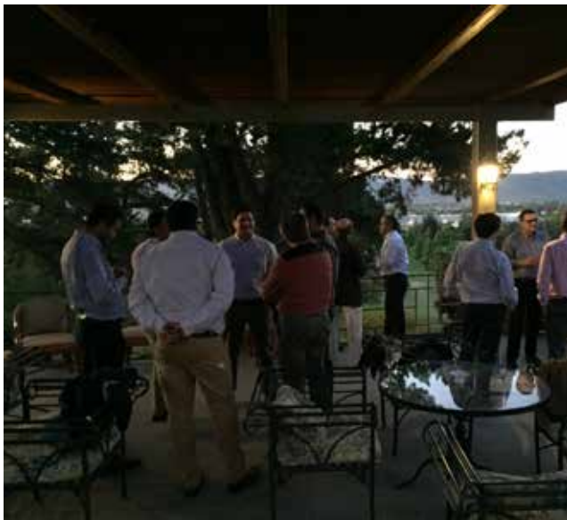
Cena Proveedores - Clientes en Talca Country Club