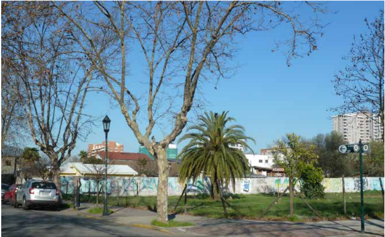
A poco más de siete años del terremoto de 2010 Talca tiene una cifra que supera las 50 hectáreas en sitios que están abandonados.

y que tuvieron una concreción exitosa, como el caso del proyecto de la plaza Las Heras en la capital regional.