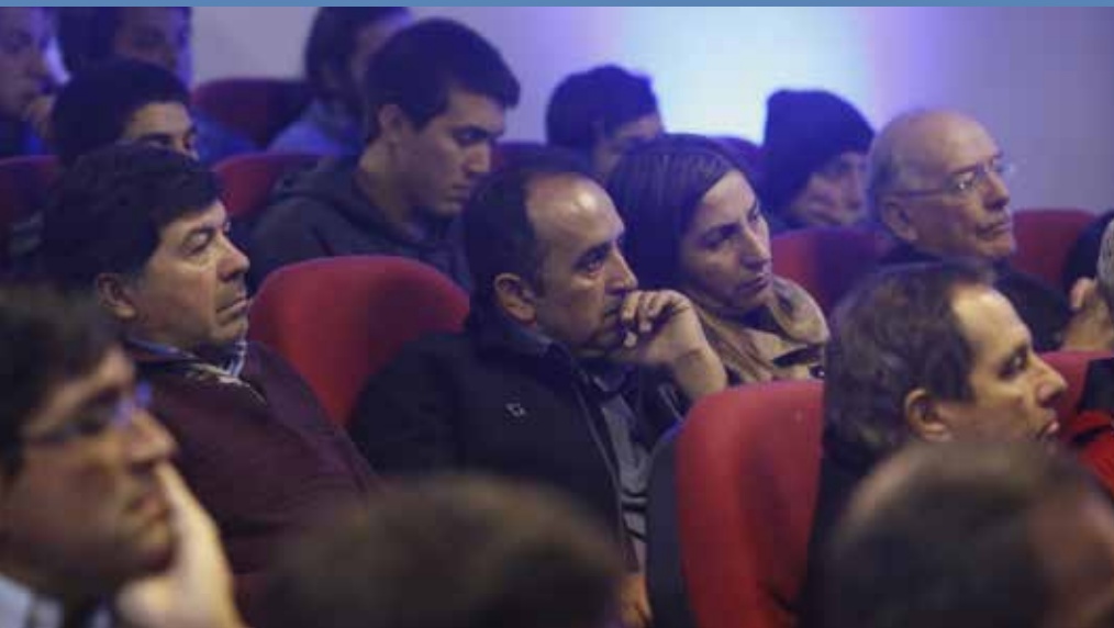
La actividad reunió a representantes gremiales, académicos, profesionales y técnicos ligados a la agricultura

actuales. 'Esto significa trasvasijar agua de zonas de superávit como La Araucanía o Biobío hacia Copiapó, pasando por toda la zona central del país, lo que permitiría recargar todos los acuíferos y los embalses que existen. Es un proyecto gigantesco y hay que mirarlo en esa dimensión y pensarlo en el largo plazo', expresó.