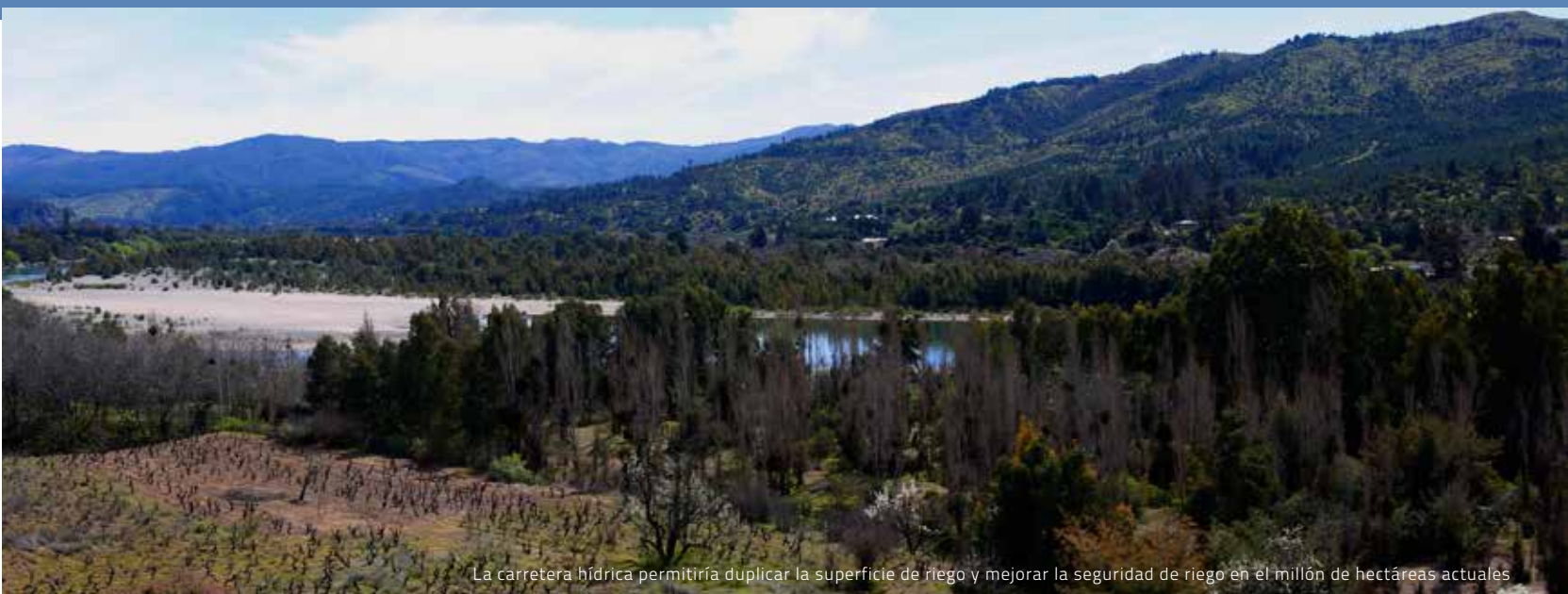
La carretera hídrica permitiría duplicar la superficie de riego y mejorar la seguridad de riego en el millón de hectáreas actuales