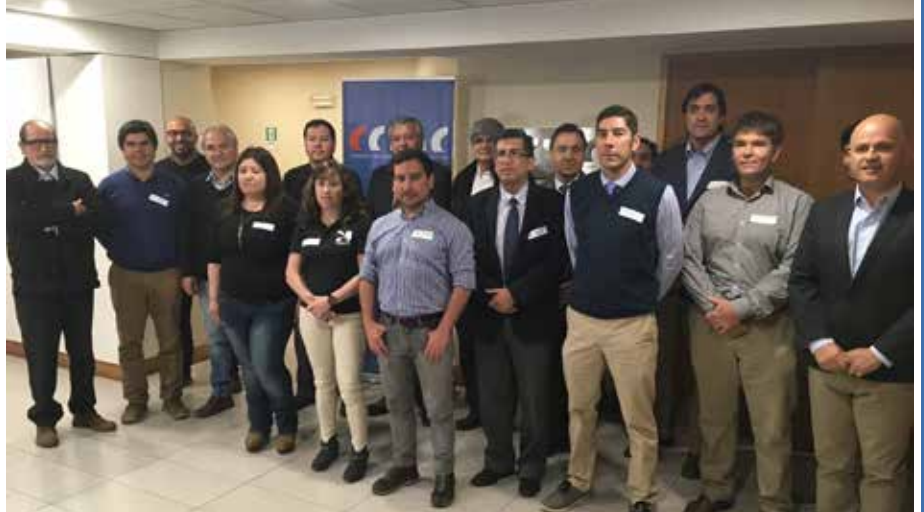
Diversas autoridades y representantes gremiales participaron del Diálogo regional realizado en la CChC Talca

El dirigente puso como un ejemplo concreto de este trabajo lo que se está haciendo en materia de conectividad al promover la doble vía en el tramo San Javier-Constitución, de manera de potenciar el Paso Pehuenche como un corredor bioceánico.