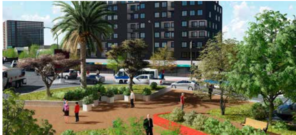
Imagen objetivo: Densificación casco histórico de Talca.