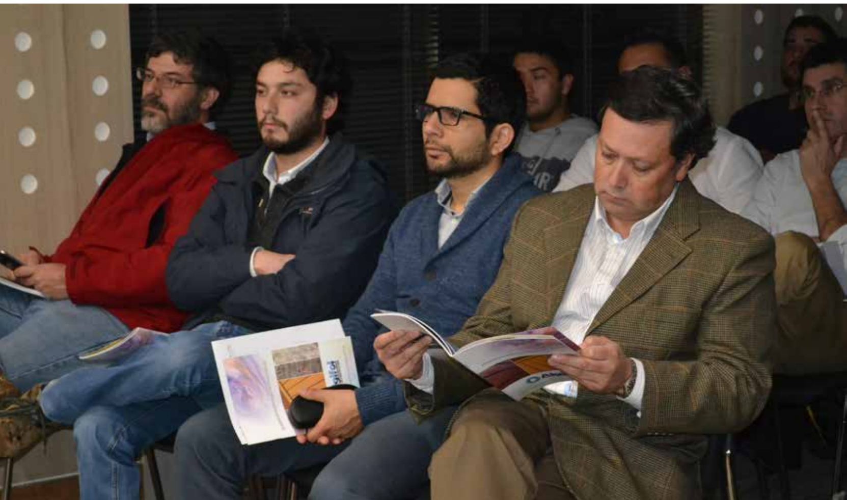
Charla técnica de proveedores en Cámara regional

El comité ha llevado a cabo diversas actividades que han tenido buena recepción por parte de los socios de la Cámara Chilena de la Construcción (CChC), acción que se coronó con una cena entre clientes y proveedores que fue calificada de muy exitosa.