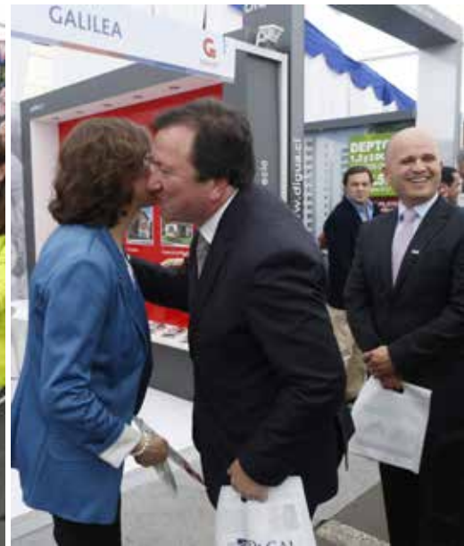
En Finta 2017 se realizaron diversas actividades orientadas a la familia, como talleres prácticos para el hogar

espacio, esta vez en el sector oriente de Talca, dio muy buenos resultados, lo que quedó reflejado en la opinión de los expositores que tuvieron una gran cantidad de visitas en los días que duró la feria y en algunos casos se cerraron rápidamente negocios. ‘Una evaluación preliminar arrojó que el lugar escogido para este año fue muy positivo para las empresas exponentes, y aun cuando el objetivo de la feria no es la generación de negocios sino dar a conocer la oferta inmobiliaria, sabemos que se cerraron algunos acuerdos, lo que nos deja muy satisfechos por la utilidad que está teniendo esta exhibición, tanto para nuestros socios como para quienes están buscando alternativas inmobiliarias y de rubros asociados’, dijo el directivo.