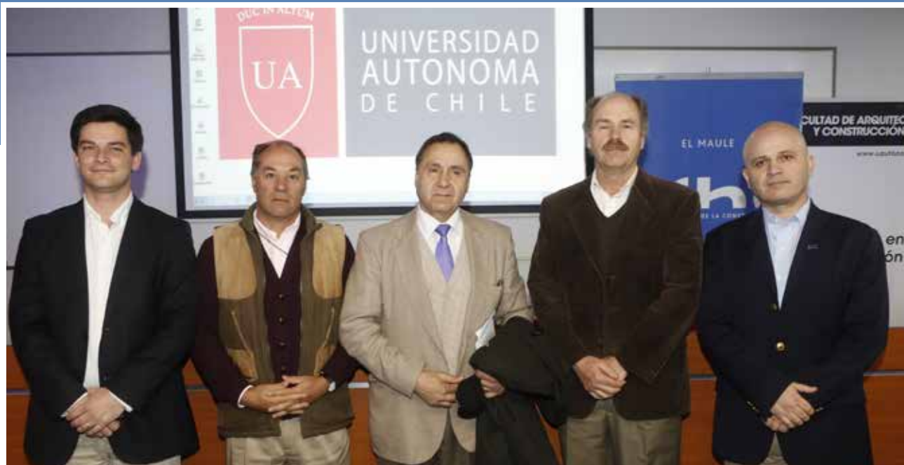
Expositores del Seminario: La Carretera hídrica que podría transformar a Chile en potencia agroalimentaria

La idea, que demandaría una inversión inicial de 20 mil millones de dólares y luego otros 35 mil millones de dólares de inversión de parte de los privados para transformar los campos de secano a campos de riego, fue relevada por la Cámara Chilena de la Construcción (CChC), que ha llevado adelante un proceso de socialización de este proyecto en las distintas regiones del país.