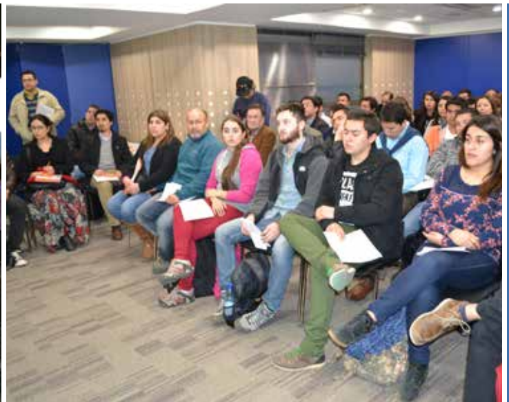
Masiva asistencia a talleres organizados por el Grupo de Proveedores