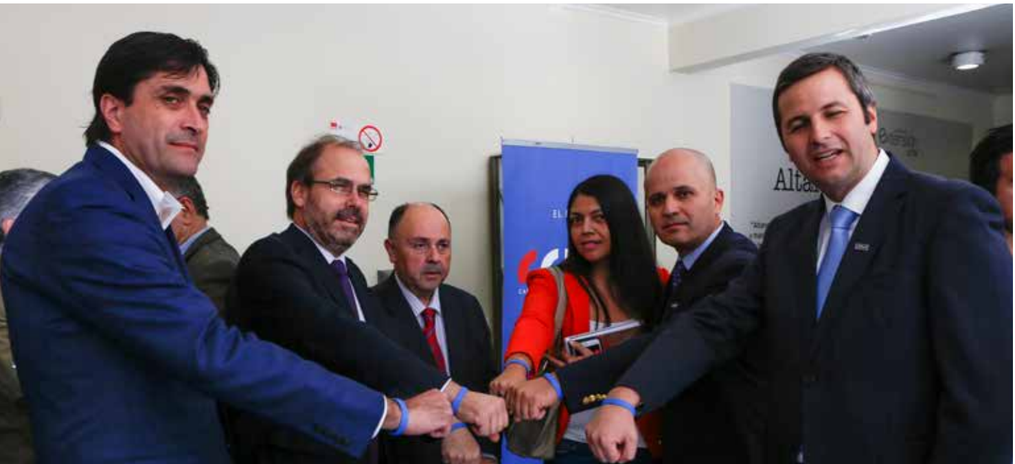
Como gremio potenciando la campaña Cero Accidentes con autoridades locales y nacionales