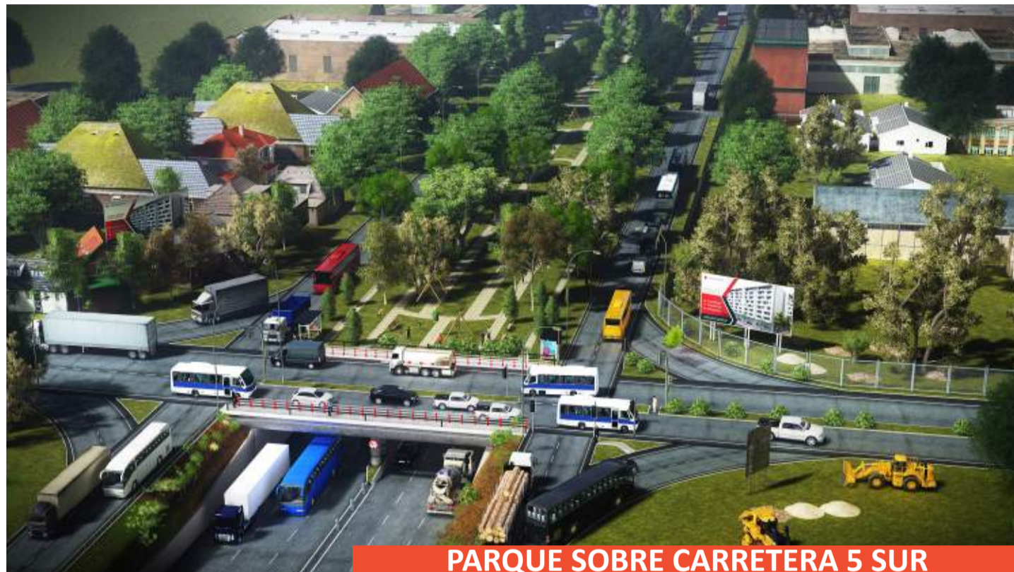
PARQUE SOBRE CARRETERA 5 SUR

Un parque elevado sobre la Ruta 5 Sur y la concreción del par vial 2-3 Sur son algunos de los proyectos que el gremio de la construcción está impulsado, a nivel local, para terminar con las “cicatrices” que históricamente han dividido en oriente y poniente a la ciudad de Talca.