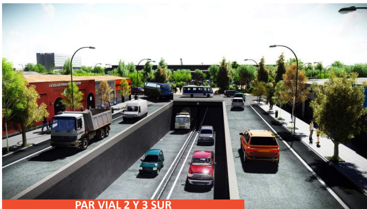
PAR VIAL 2 Y 3 SUR

Así es como el año pasado, la CChC Talca conformó la Mesa de Planificación de Infraestructura Crítica para la Región del Maule, dando inicio a un diálogo multisectorial, del cual se levantaron las principales necesidades de la zona.