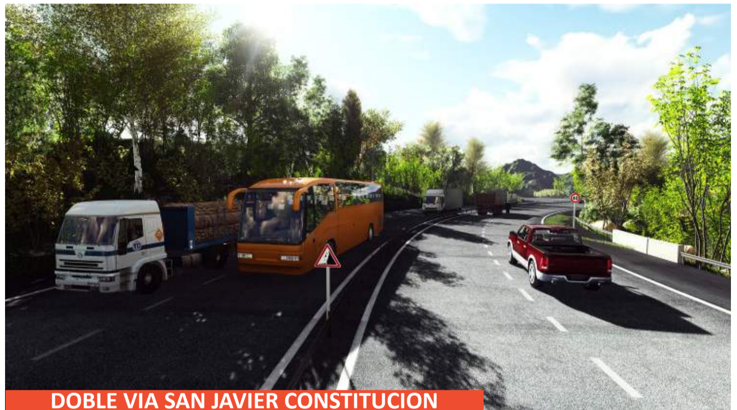
DOBLE VIA SAN JAVIER CONSTITUCION