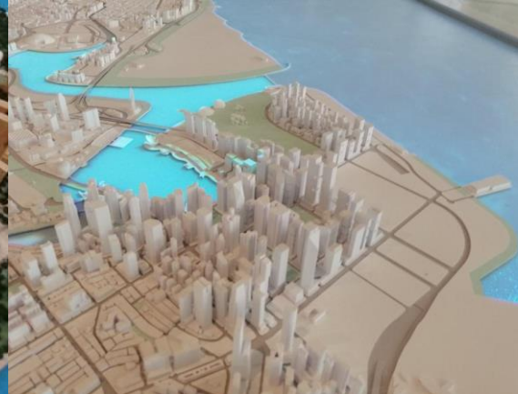
Una maqueta para Punta Arenas